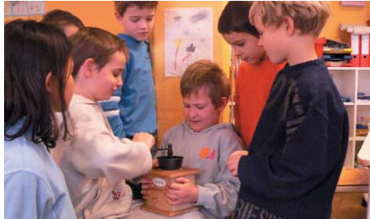
Mahlen mit der Handmühle

Mehrmals im Jahr treffen sich alle Kinder der Grundschule, um die Projektstage durchzuführen. Bereits bei der Themenfindung sind die Schüler mit einbezogen. Zum Abschluss der Woche stellt jede Gruppe ihre Werke vor. Danach fragen die Kinder begeistert: »Wann sind wieder Projektstage?«