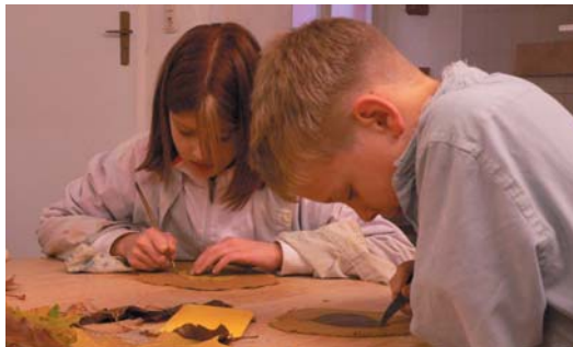
Arbeiten mit Ton