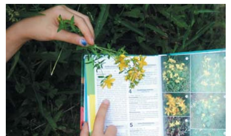
Arbeit mit dem Bestimmungsbuch

Die guten Ergebnisse des Projekts überzeugten die Jury der »Deutschen Gesellschaft für Umwelterziehung«. Wir erhalten Stempel und Flagge und dürfen uns fortan als »Umweltschule in Europa« bezeichnen.