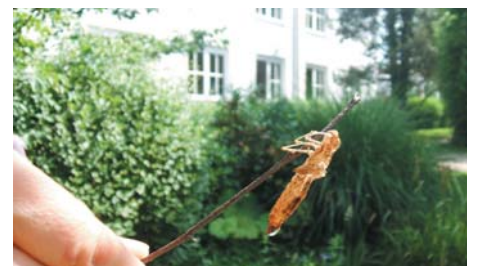
Die Lybellenspuppe wird bewundert

Aktuelle News und Infos aus dem Schulleben unter: www.LERNMITMIR.org