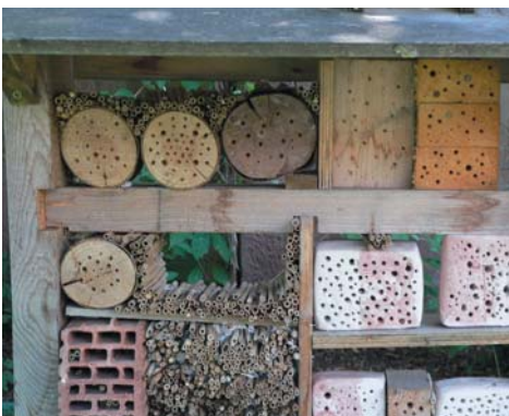
Ausschnitt eines Insektenhotels

Das Projekt "Biodiversität" wurde im Zusammenhang mit unseren Hecken im Schulgarten durchgeführt: